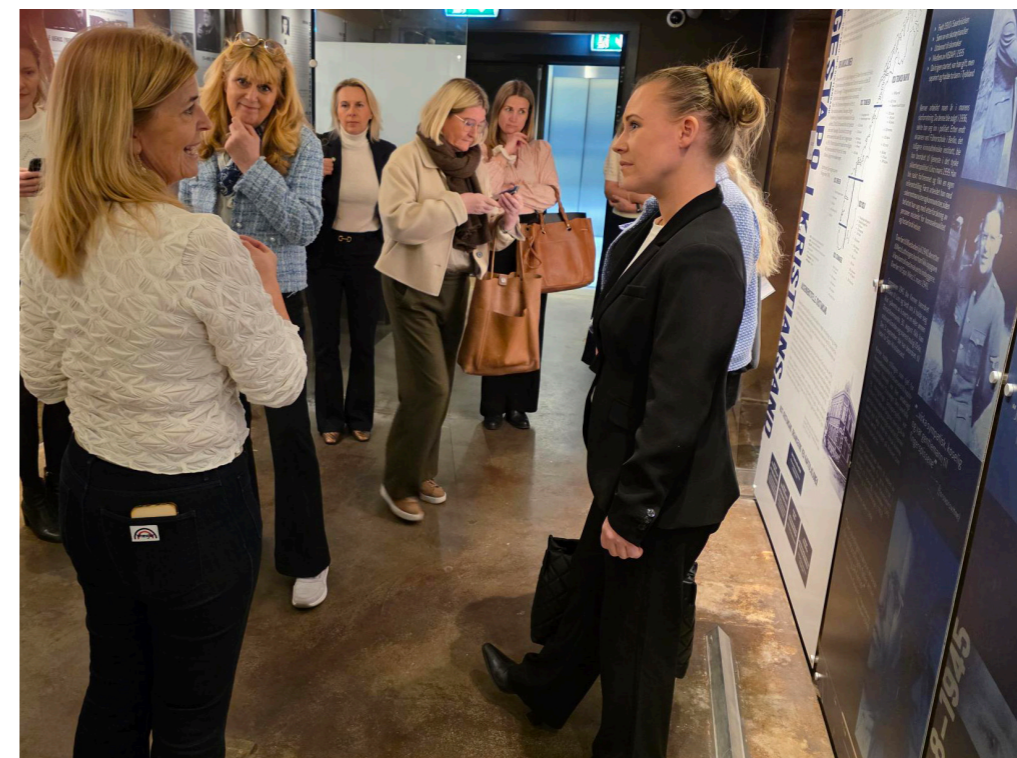
MINISTERBESØK: Barne- og familieminister Lene Vågslid er en av flere ministre som besøkte ARKIVET i 2025, og som fikk med seg et besøk i Brennpunkt Arkivet og et innblikk i den lokale krigshistorien som utstillingen formidler