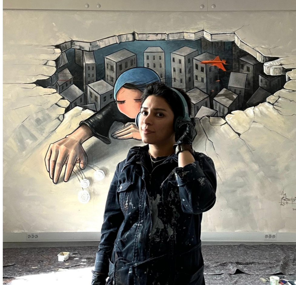
KUNSTVERK: Graffitikunstner Shamsia Hassani foran kunstverket hun malte til utstillingen Minnekammeret - barn og krig under sitt opphold i Kristiansand i august 2025

Bøkene samler personfortellinger og fagtekster som kontekstualiserer utstillingen, og representerer sentrale kunnskapsbidrag fra