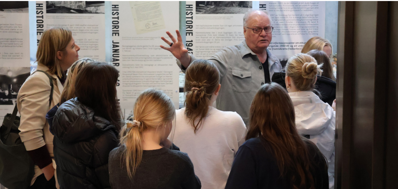
OMVISNING: Gjennom året kommer en rekke besøkende, både elever og andre, for å bli kjent med historien som er knyttet til bygningen ARKIVET freds- og menneskerettighetssenter holder til i

«En sterk opplevelse». «En flott institusjon som gjør viktig arbeid». I 2025 var det 80 år siden andre verdenskrig tok slutt, og frigjøringsjubileet har gått som en rød tråd gjennom et år med høy aktivitet og mange menneskemøter. Tilbakemeldingene fra publikum viser at ARKIVETs mangfoldige arbeid og formidling med utgangspunkt i historien